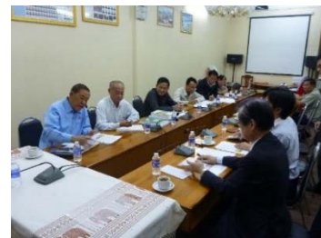
ラオス国かんがい局メイコン局長との会談