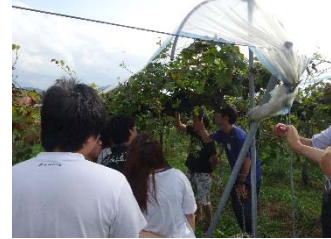
大学生の農業農村体験（大分県）