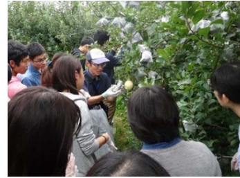
大学生の農業農村体験（鳥取県）