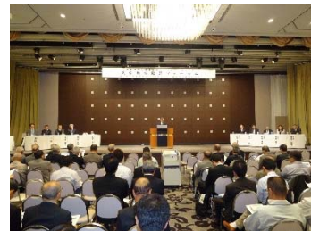
浜松地域振興フォーラム