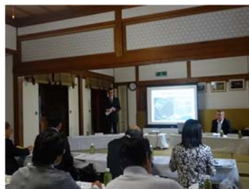
寒河江語り部ゼミナール