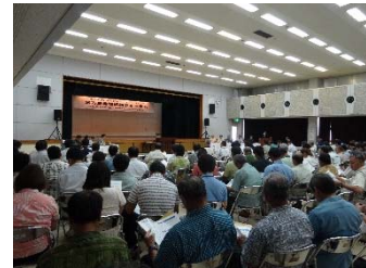
宮古島地域振興フォーラム