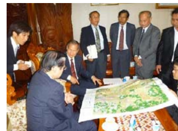
ラオス国農業副大臣との会談