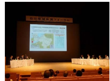
益田地域振興フォーラム