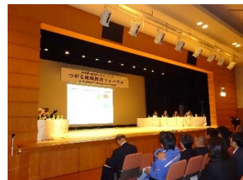
つがる地域振興フォーラム