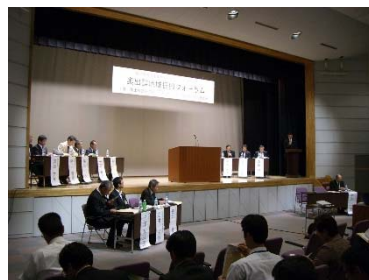
奥出雲地域振興フォーラム