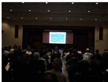
笠岡地域振興フォーラム