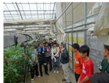
大学生の農業農村体験（長崎県）