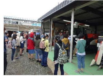
大学生の農業農村体験（山梨県）