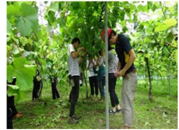
大学生の農業農村体験（滋賀県）