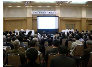
寒河江地域振興フォーラム